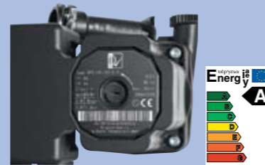
Modulerende Bosch pomp energieklasse A