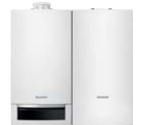
Logamax plus GB172 met naastgeplaatste Logalux H65W

De Logamax plus GB172 is compatibel met talrijke rookgasafvoersystemen. Het maakt niet uit waar uw ketel geplaatst is (kelder, zolder, keuken, ...) er bestaat altijd een gepaste oplossing voor de rookgasafvoer.