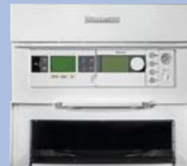
Goed toegankelijke basiscontroller